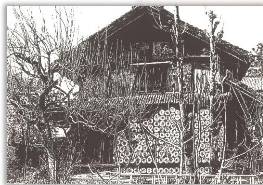
第19回 一般の部/大賞作品