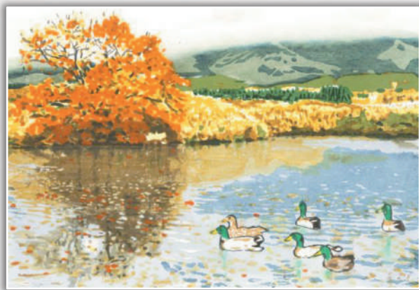
第21回 一般の部/大賞作品

伝えたい「 さき 未来」がある。残しておきたい「 いま 現在」がある。出逢っておきたい「 あなた 自分」がいる。