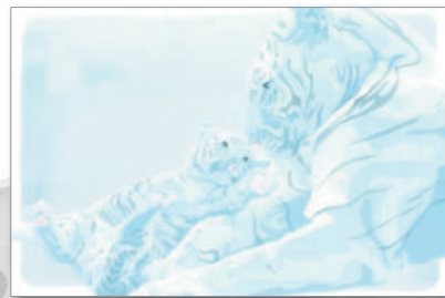
<第21回 一般の部/優秀賞作品>

これらの作品は、作者にとってはもちろん当博物館にとっても大切な宝物となっています。あなたの感性を版画絵はがきに表現してみませんか。版画絵はがきコンテストを通じてお互いの交流をより一層深めましょう。